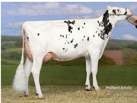
Meita: Xenia VG-86