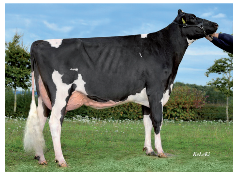
Vecāmāte: Js Rosie