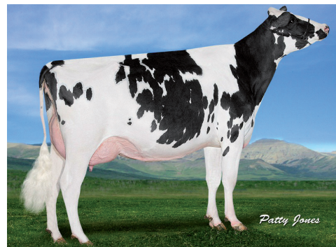
Vecvecmāte: Gold-N-Oaks MVP Aria 2815