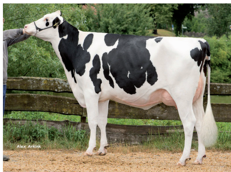
Vecāmāte: Colonia Cows Larissa