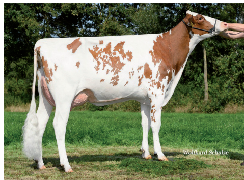
Meita: Robika P GP-84