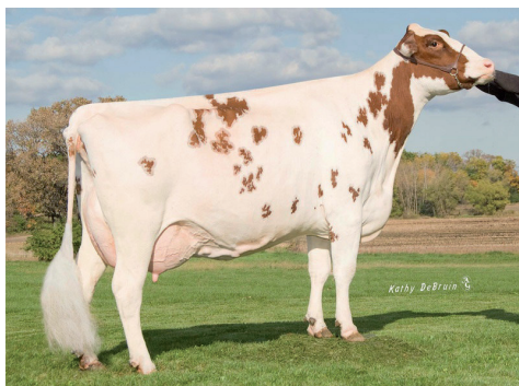
7. māte: Golden-Oaks Perk Rae-Red P