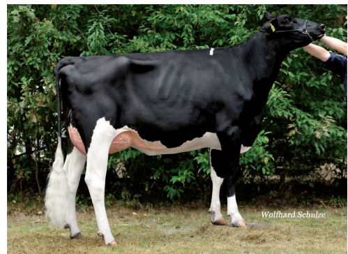
Māte: Wendland Holsteins Quintina