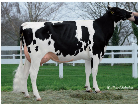
Meita: WSH Gorja GP-84