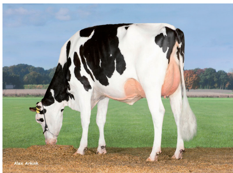
Vecāmāte: Colonia Cows Larissa