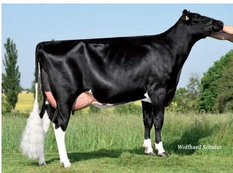
Māte: MHD Sina P